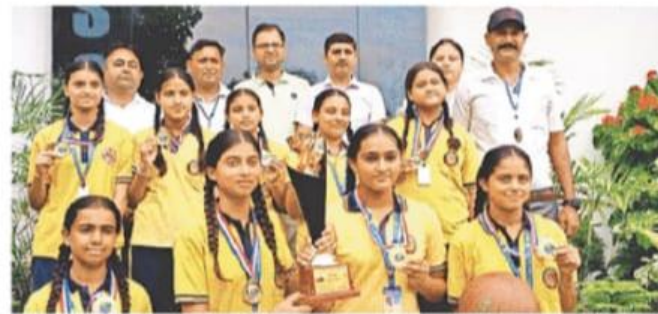
जिलास्तरीय बास्केटबाल स्पर्ध में भाग लेने वाली सेक्रेड सोल स्कूल की छात्राएं